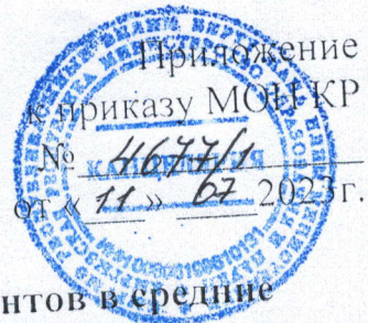
График проведения туров отбора и зачисления абитуриентов в средние профессиональные учебные заведения Кыргызской Республики на 2023-2024 учебный год